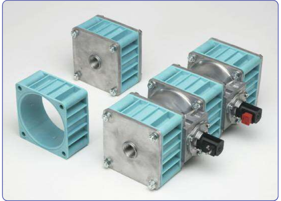
Speicherzwischenstücke aus langglasverstärktem PA einzeln und mehrfach verbaut für Luftspeicher.

Für das Spritzgießen verwenden wir bereitgestellte Formen. Oder wir konstruieren und bauen das benötigte Werkzeug nach Ihren Zeichnungen oder Mustern. Dazu setzen unsere hochqualifizierten Mitarbeiter des hauseigenen Werkzeugbaus modernste CAD/CAM-Systeme ein.