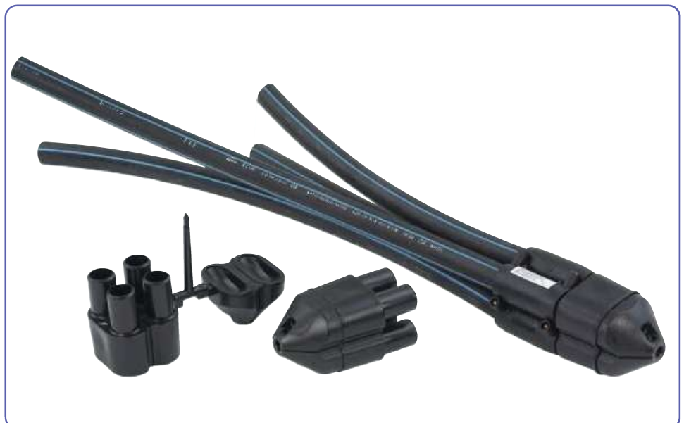
Sondenkopf mit Anguss, ungeschweißt – Sondenkopf geschweißt – Sondenkopf mit Sondenrohren verschweißt.

LA-KA-PE verarbeitet sämtliche spritzbare Thermoplaste. Auch die Herstellung von Artikeln mit Teilgewichten zwischen 1 und ca. 8000 g unterstreicht unsere vielfältige Leistungspalette. Groß- und Kleinserien, Massenartikel und Präzisionsteile produzieren wir wirtschaftlich und termingerecht.