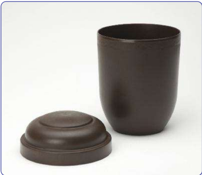
Urne aus 100% Biomaterial.

Wir fertigen hochwertige Spritzgießteile in Ihrem Auftrag. Auch bei besonderen Problemen stehen wir Ihnen mit unserem gesamten Know-how zur Verfügung, um mit Ihnen gemeinsam spezielle Lösungsmöglichkeiten zu realisieren.