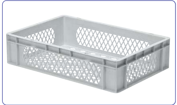
TK 600/145-2 mit Metallpulver.