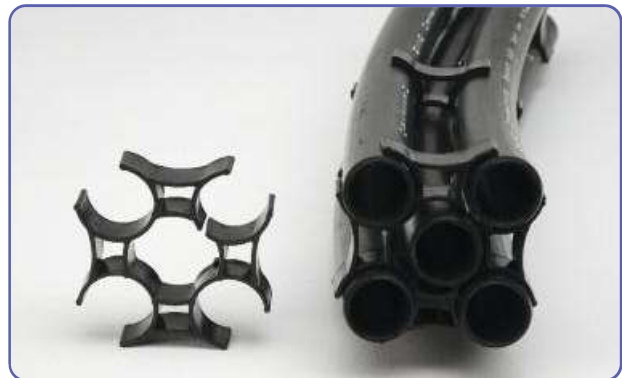
Sondenstern, einzeln und in Sondenrohre eingebaut, für Erdwärmesonden.

Wir fertigen hochwertige Spritzgießteile in Ihrem Auftrag. Auch bei besonderen Problemen stehen wir Ihnen mit unserem gesamten Know-how zur Verfügung, um mit Ihnen gemeinsam spezielle Lösungsmöglichkeiten zu realisieren.