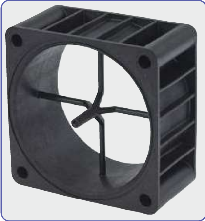
Speicherzwischenstück aus langglasverstärktem PA. Ersetzt Alu-Druckgussteil.

Für das Spritzgießen verwenden wir bereitgestellte Formen. Oder wir konstruieren und bauen das benötigte Werkzeug nach Ihren Zeichnungen oder Mustern. Dazu setzen unsere hochqualifizierten Mitarbeiter des hauseigenen Werkzeugbaus modernste CAD/CAM-Systeme ein.