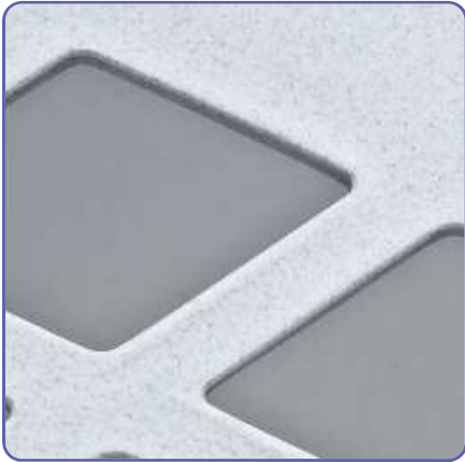
Detailbild Gitter TK 600/145-2.

LA-KA-PE-Spritzgießteile zeichnen sich durch ihre hohe Verarbeitungsqualität aus. In sämtlichen Produkten steckt die lange Erfahrung eines traditionsreichen Kunststoffverarbeiters.