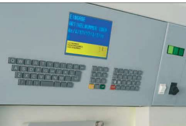
Új Hänel Rotomat, színes CSTN kijelzős, vezérlés (opcionális)

Amennyiben céljai között készlet-menedzsment vagy az irodai kartotékrendszer felépítése szerepel, végsősoron a vezérlési rendszer az, amely meghatározza a működést és a hatékony felhasználást.