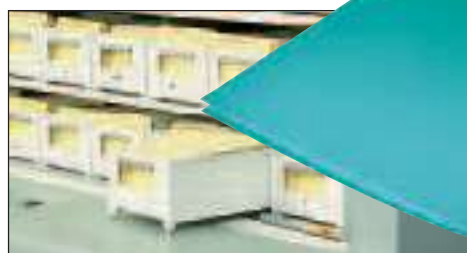
... kartoték kártya tároló dobozok