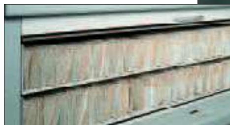
... álló mappák