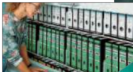
... álló dossziék