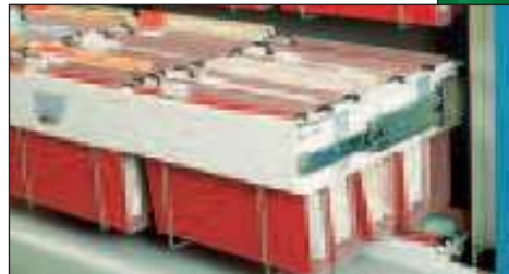
... függőmappás tárolás

A mikroprocesszoros vezérlő egység hálózatba kötött működési lehetőséget kínál közvetlen kapcsolatot létrehozva a számítógép vagy egyéb perifériák és a Rotomat rendszer között. Az így felépített iroda olyan általános kellene, hogy legyen, mint egy asztali számítógép.