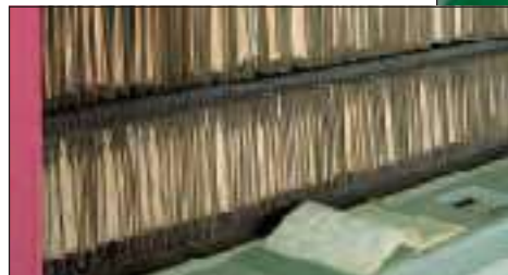
... közepén függesztett mappák